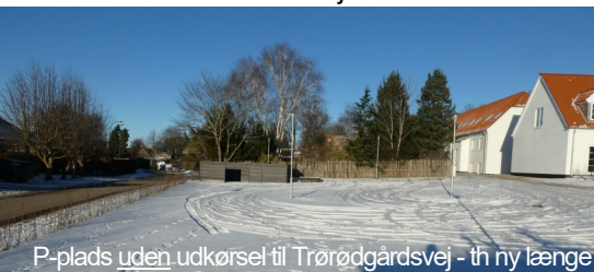
P-plads uden udkørsel til Trørødgårdsvej - th ny længe

TGF var da stærkt optaget med planer for Torvet fornyelse og blev på opfordring fra kommunen inviteret med til møder om Kypergården. Se MO44&45. TGF ønskede at bevare bygningernes ydre udtryk, og det opfyldte det fremlagte forslag, men TGF trak sig lidt for ikke at fremstå som anbefaler af forslaget. Især de trafikale forhold vakte voldsom debat i 2017. Skulle tilkørslen foregå ad og dermed belaste den stille Trørødgårdsvej eller direkte til Kohavevej? Begge har dårlige oversigtsforhold ved udkørsel til Kohavevej.