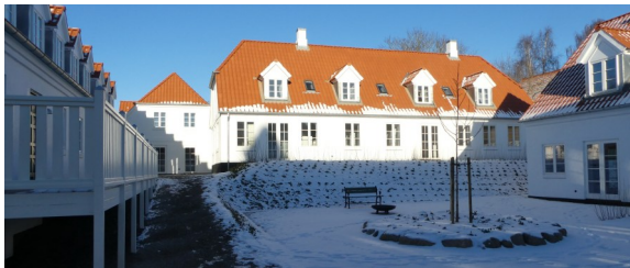
En nye havegård nedenfor den gamle hovedbygning th den ene af de 2 nye længer.

I de sidste mange år er ejendommen forfaldet mere og mere, indtil et byggekonsortium overtog stedet og i 2014 fik udarbejdet en meget ambitiøs plan for renovering og udvidelse med 2 længer ved arkitekt maa Johnny Svendborg.