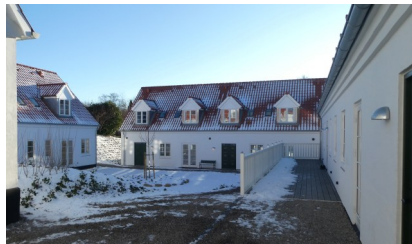
De 2 nye længer set fra passagen højre om hovedbygningen.

TGF var da stærkt optaget med planer for Torvet fornyelse og blev på opfordring fra kommunen inviteret med til møder om Kypergården. Se MO44&45. TGF ønskede at bevare bygningernes ydre udtryk, og det opfyldte det fremlagte forslag, men TGF trak sig lidt for ikke at fremstå som anbefaler af forslaget. Især de trafikale forhold vakte voldsom debat i 2017. Skulle tilkørslen foregå ad og dermed belaste den stille Trørødgårdsvej eller direkte til Kohavevej? Begge har dårlige oversigtsforhold ved udkørsel til Kohavevej.